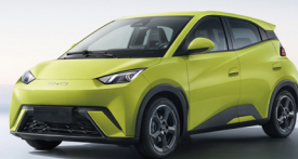
380KM NEDC de Autonomía