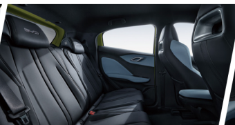
Espacio Interior Optimizado