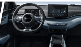
Sistema de Cabina Inteligente BYD