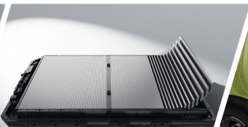
Ultra-Safe Batería Blade