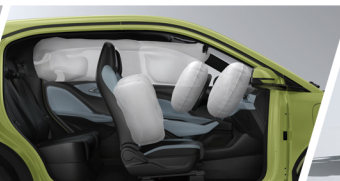
Equipado con 6 Bolsas de Aire