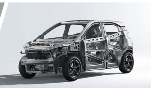
Estructura Corporal de Alta Resistencia