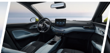
Cabina Ocean Chic