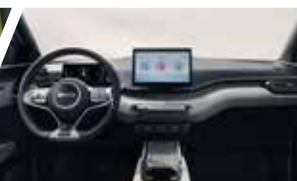
Sistema de cabina inteligente BYD