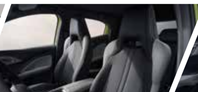
Espacio Interior Optimizado