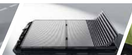
Ultra-Safe Batería Blade