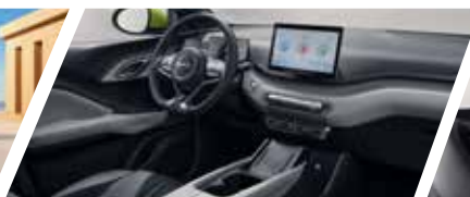
Cabina Ocean Chic