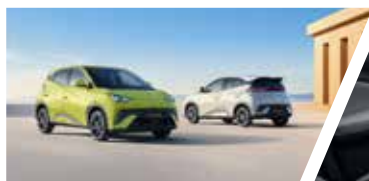
380km (NEDC) de Autonomía