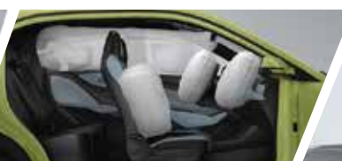
Equipo con 6 Bolsas de Aire