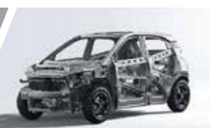
Estructura Corporal de Alta Resistencia